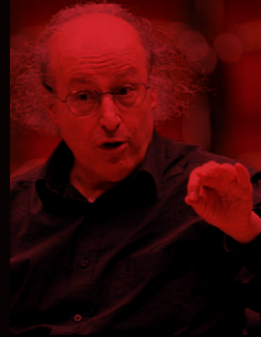
ELIAHU INBAL DIRECTOR