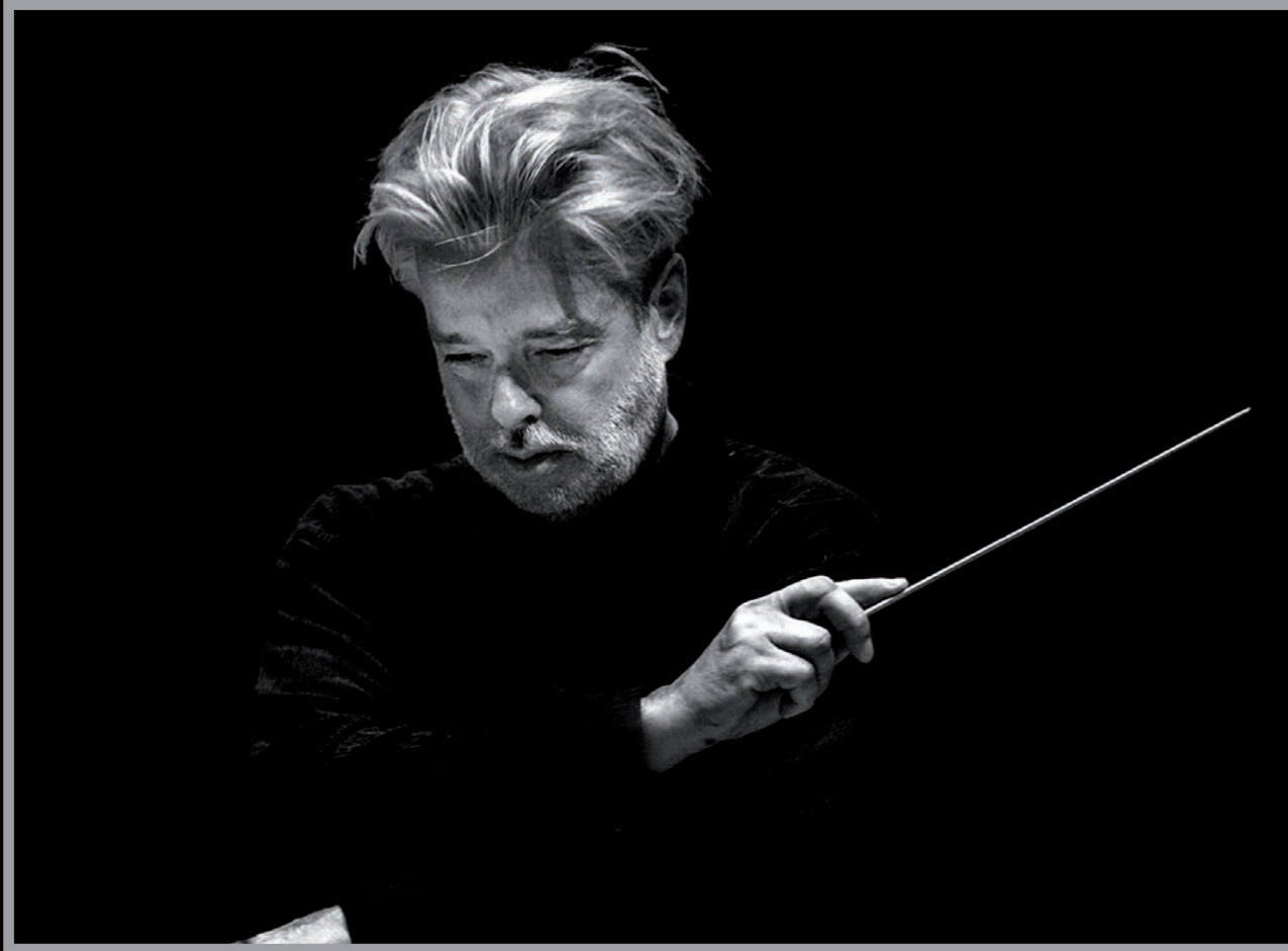
JUKKA-PEKKA SARASTE DIRECTOR

ESCUELA PROFESIONAL DE DANZA DE CASTILLA Y LEÓN